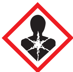
Symbol and Signal word: Danger GH508

A kockázat más országokban is felismerésre került, és várhatóan a jövőben Kanada és az Egyesült Államok is követi az EU-s példát